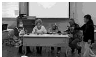
実践報告1：グループシャボン玉による「老いるということの理解～寸劇を通して～」